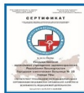
Рис. 10. Интегрированная система менеджмента качества ГАУЗ РБ ГKB № 18 г.Уфы признана соответствующей требованиям стандарта ГОСТ Р ИСО 9001 2015 и Системы добровольной сертификации «Качество и безопасность медицинской деятельности».

Проект оказал заметное влияние на культуру медицинской организации в целом, способствовал укреплению отношений в коллективе и улучшению взаимопонимания сотрудников с пациентами. Именно глубинных изменений необходимо добиваться для успешной реализации проекта.