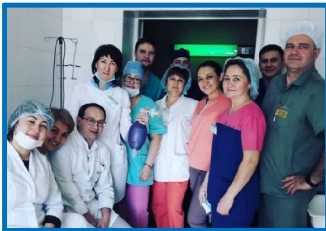
Рис. 9. Всеобщая приверженность качеству – одно из главных условий эффективности системы менеджмента качества.

Как мы уже сообщали , в 2019 году ГАУЗ РБ ГKB № 18 г. Уфы прошла сертификацию на соответствие системы менеджмента качества требованиям стандарта ГОСТ Р ИСО 9001 2015. Это событие стало важной вехой на пути к совершенству.