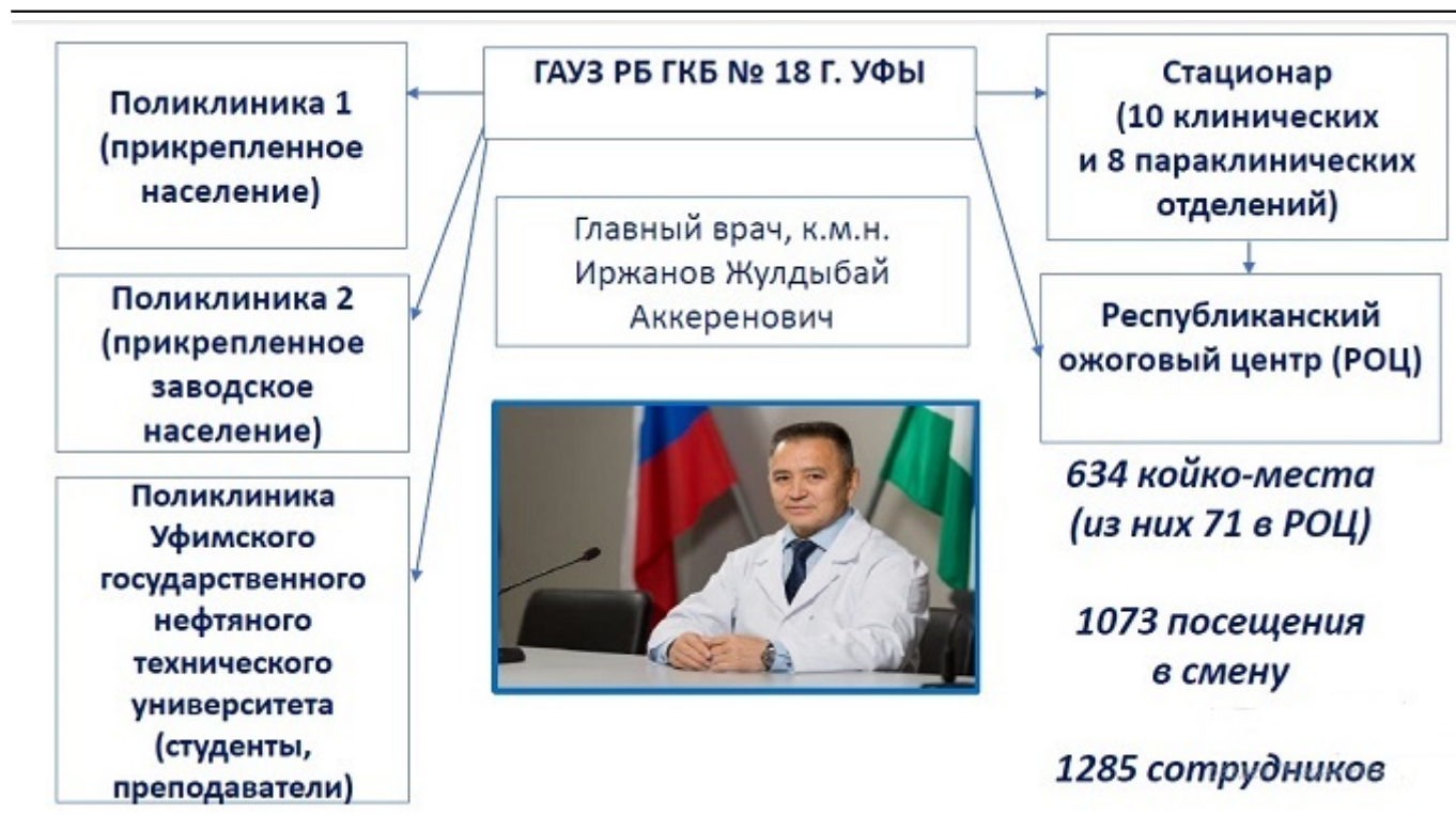
Рис. 3. Государственное автономное учреждение здравоохранения Республики Башкортостан Городской клинической больницы № 18 города Уфы.

В ГАУЗ РБ ГKB № 18 г.Уфы изначально был взят курс на создание интегрированной системы менеджмента качества (ИСМК), отвечающей требованиям международных, национальных и отраслевых стандартов в области менеджмента качества и функционирующей, как единое целое. Были определены и отражены в приказах главного врача цели и задачи проекта, назначен его руководитель, сформирована его команда, созданы рабочие группы по основным направлениям менеджмента качества и безопасности медицинской деятельности.