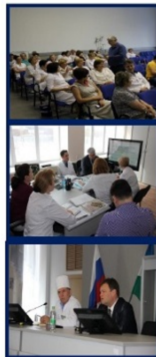
Рис. 8. Основные препятствия на пути реализации проекта по внедрению системы менеджмента качества в ГАУЗ РБ ГKB № 18 г.Уфы.

Команда проекта в ГАУЗ РБ ГKB № 18 г.Уфы также столкнулась с рядом препятствующих обстоятельств, но была к ним морально готова. Активная позиция руководства больницы, целенаправленные усилия команды проекта, помощь грамотных консультантов позволили добиться полной вовлечённости коллектива в благое и ответственное дело улучшения качества и повышения безопасности медицинской деятельности и оказываемой пациентам медицинской помощи.