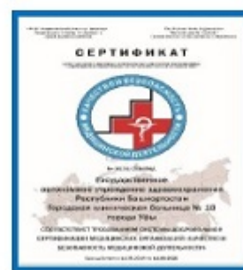
Рис. 10. Интегрированная система менеджмента качества ГАУЗ РБ ГKB № 18 г.Уфы признана соответствующей требованиям стандарта ГОСТ Р ИСО 9001 2015 и Системы добровольной сертификации «Качество и безопасность медицинской деятельности».

Проект оказал заметное влияние на культуру медицинской организации в целом, способствовал укреплению отношений в коллективе и улучшению взаимопонимания сотрудников с пациентами. Именно глубинных изменений необходимо добиваться для успешной реализации проекта.