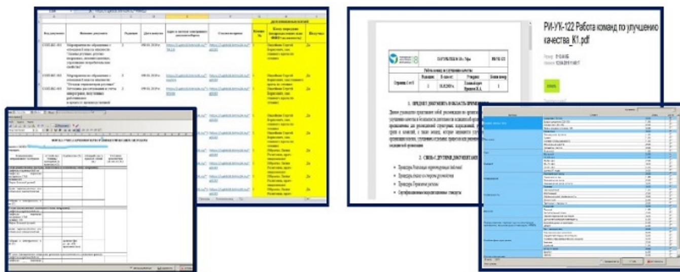
Рис. 7. Автоматизированный реестр документов системы менеджмента качества.

Реализация проекта ИСМК в медицинской организации никогда не бывает простой. В российском здравоохранении широкое внедрение современных принципов и технологий менеджмента качества сдерживается сложным комплексом объективных факторов, имеющих прочные культурные корни. Внешние (средовые) факторы взаимодействуют с внутренними, которые в каждой медицинской организации имеют свои особенности. Преодолевается это всё с трудом.