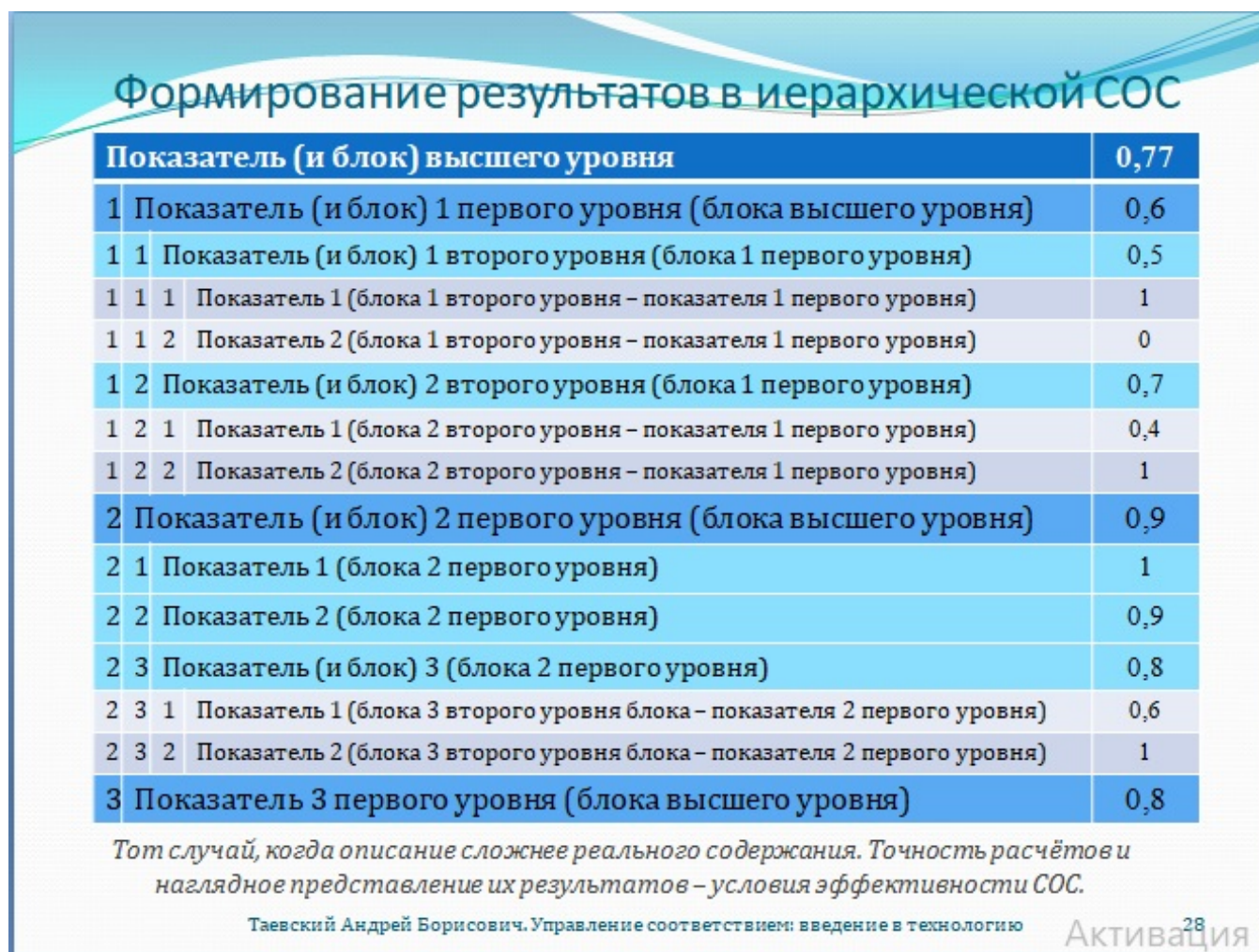
Рис. 28. Формирование результатов в иерархической системе оценки соответствия