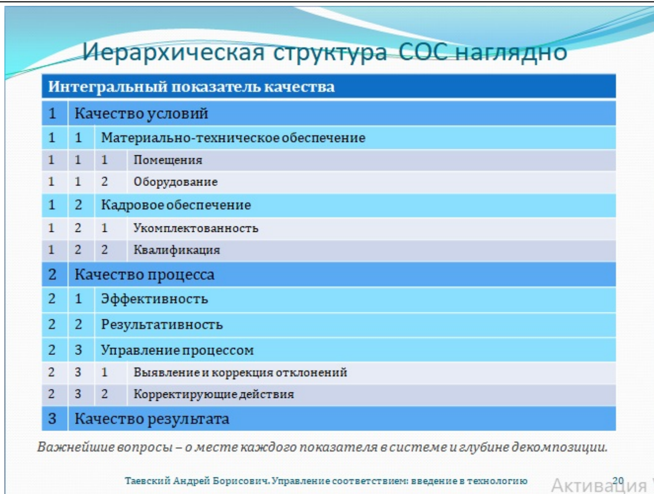
Рис. 20. Иерархическая структура системы оценки соответствия наглядно

Не бывает беспредметного качества. Вначале следует прояснить, что под ним подразумевается, и как его измерить. Можно ли оценивать качество на глазок или, там, по какому-нибудь чек-листу? Почему бы и нет, ведь от намётанного глаза эксперта ничто не утаить! Однако малая глубина неизбежно порождает произвол в оценке соответствия с крайне негативными последствиями в виде необоснованной и вводящей потребителей в заблуждение сертификации, коррупции внутри и вне СДС, грубости и формализации управления. Управление без достаточной детализации анализа вообще вряд ли возможно. Вы можете довериться