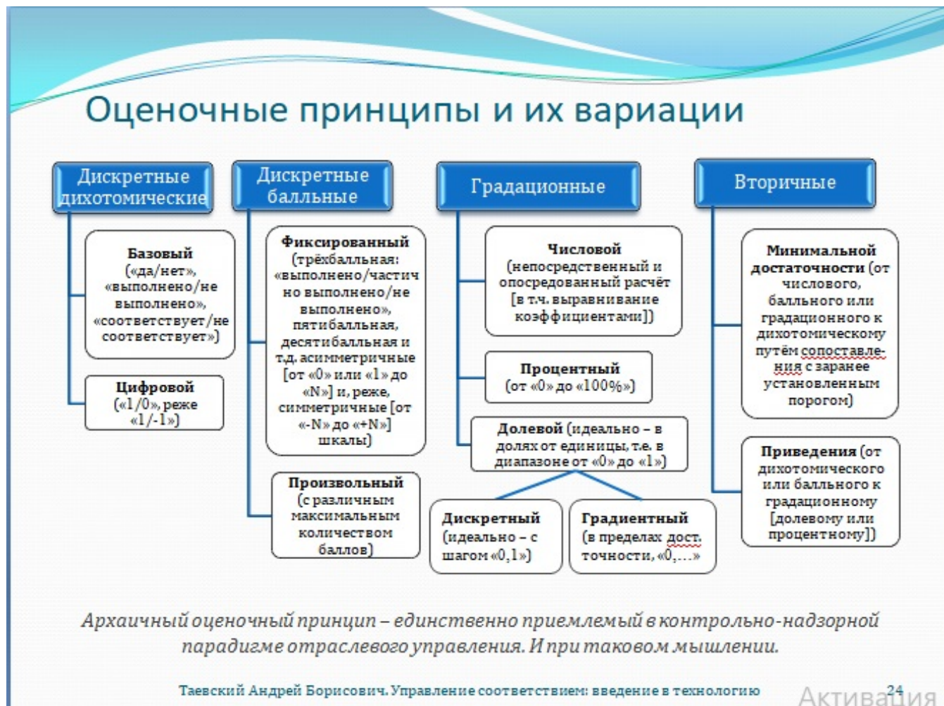
Рис. 24. Оценочные принципы и их вариации

Способы нахождения значений показателей принципиально важны. В контрольно-надзорной деятельности единственным возможным принципом оценки соответствия является дискретный дихотомический в базовом либо