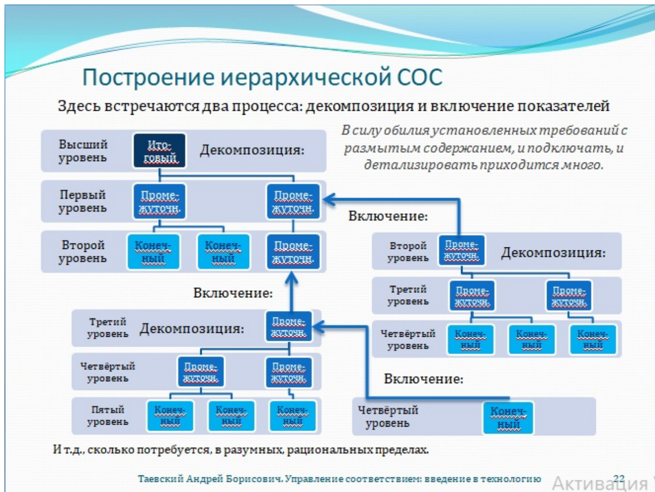
Рис. 22. Построение иерархической системы оценки соответствия