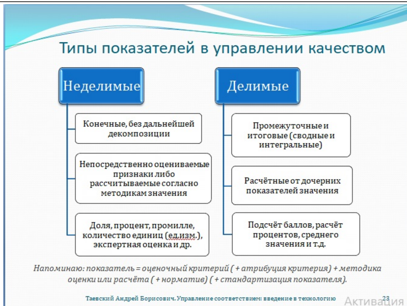
Рис. 23. Типы показателей в управлении качеством

Как только вы раскладываете общую оценку чего-либо на составляющие, у вас появляется, как минимум, два типа показателей: те, значения которых непосредственно рассчитываются на основе объективных данных либо оцениваются экспертом, и те, значения которых определяются путём сведения получающихся результатов заранее определённым способом. Первые соответствуют «конечным», иначе «неделимым» оценочным критериям – т.е., тем, что дальше на составляющие уже не раскладываются. Вторые замыкают вершины иерархий оценочных критериев, а также образуют все промежуточные оценки между конечными и итоговыми