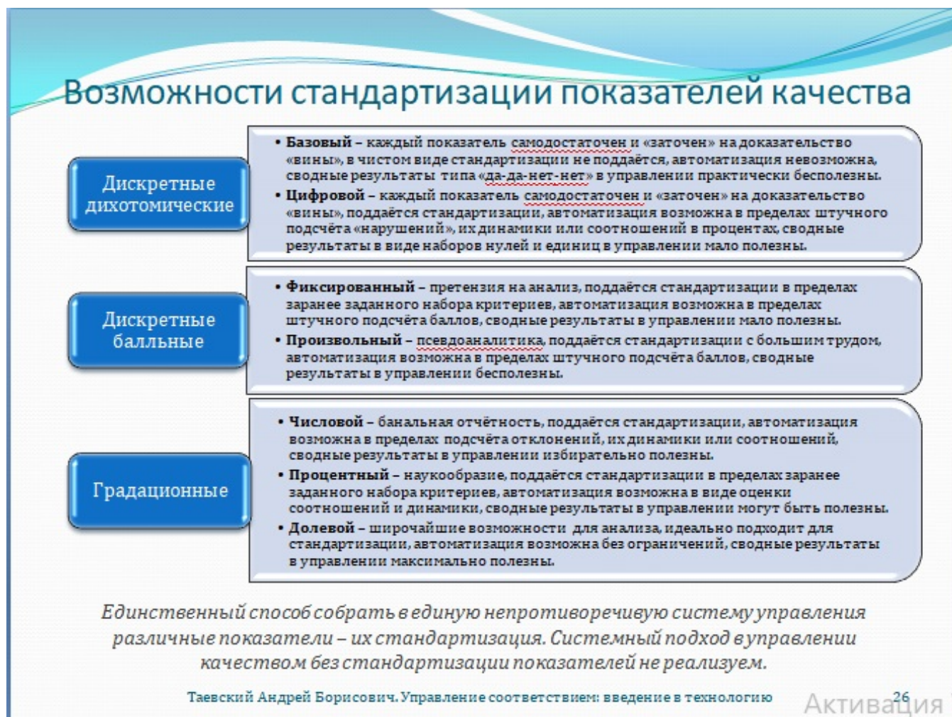
Рис. 26. Возможности стандартизации показателей качества

Дихотомический оценочный принцип удобен однозначными юридически значимыми выводами о годном либо негодном состоянии отдельных признаков. Выводы однако всецело находятся во власти эксперта, а оценки не представляют ценности без его пояснений. Кроме того, сводные результаты в виде списков положительных и отрицательных ответов в управлении качеством тем менее полезны, чем больше общее число