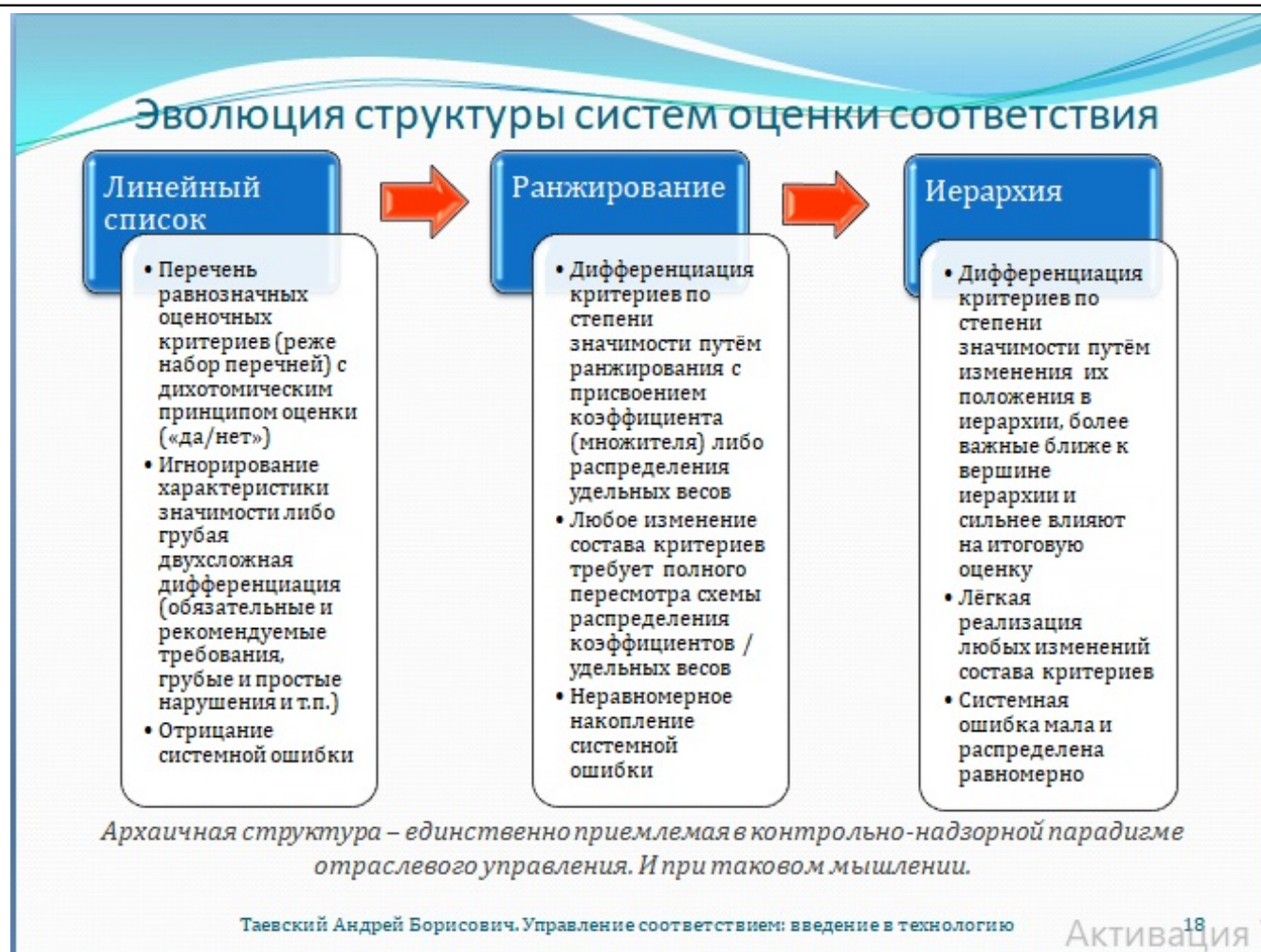
Рис. 18. Эволюция структуры систем оценки соответствия

Требования всегда как-то упорядочены. Применение линейных перечней уместно тогда, когда необходимо обозначить строго обязательный ограниченный набор критически важных признаков, которые возможно оценить категорично. Т.е., не так уж часто. К сожалению, безудержное размножение отраслевых требований в нашей стране исключает какую-либо ограниченность таких перечней – их появляется всё больше и больше. В линейном перечне все признаки равны, однако, важность оцениваемой позиции для дела, сложность её содержания или смысловая неоднозначность имеют значение, как и множество других параметров