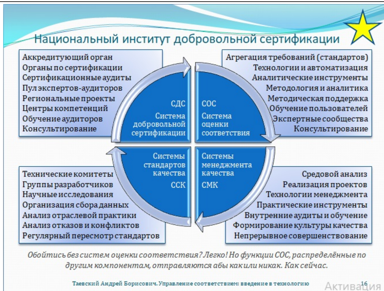
Рис. 16. Национальный институт добровольной сертификации

Вопреки расхожему мнению, национальный институт добровольной сертификации не равен системе добровольной сертификации (СДС), даже если назвать её «национальной» и снабдить проектами по созданию систем менеджмента качества в организациях на её основе. Смешение понятий произошло вследствие того, что институт добровольной сертификации в отечественном здравоохранении в настоящее время переживает второе рождение. Его началом можно считать появление в 2015 году первой версии Предложений (практических рекомендаций) Росздравнадзора по организации внутреннего контроля качества и безопасности медицинской